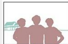
駅舎の一部が背景に写っているもの