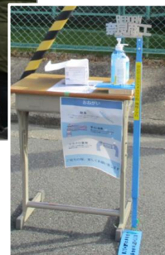
足踏み式アルコール消毒器 (協力：奈良朱雀高校)