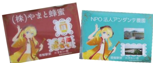
マスコットキャラクター入り店名紹介 (協力：大阪芸術大学学生)